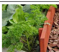
Petroselinum crispum 'Verta' RZ KRUSBLADIG PERSILJA Mörkgrön och finkrusig med kraftiga blad och skaft.

Persilja tar 3-4 veckor på sig att gro och 2-3 månader till innan den kan skördas. Sär du persilja i början av mars kan den kanske vara färdig till midsommar. Vi sår två sorter, krusbladig Petroselinum crispum 'Verta' och slätbladig Petroselinum crispum 'Comun 2'. Vi sår båda sorterna i plantboxar med ca 100-150 frö i varje som vi sedan säljer för utplantering. Krusbladig sår vi också i pluggar som sedan sätts tre och tre i 2-literskrukor för den som vill ha en rejäl kruka att ta av utanför köksdörren eller på balkongen.