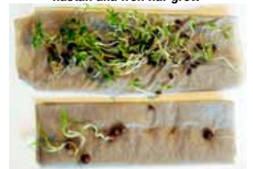
Koriander, två frön av sex har grott

Krusbladig persilja, nästan alla frön har grott