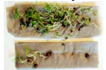
Koriander, två frön av sex har grott

Krusbladig persilja, nästan alla frön har grott